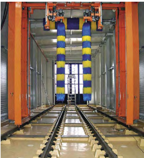
Zugwaschanlage DB AG