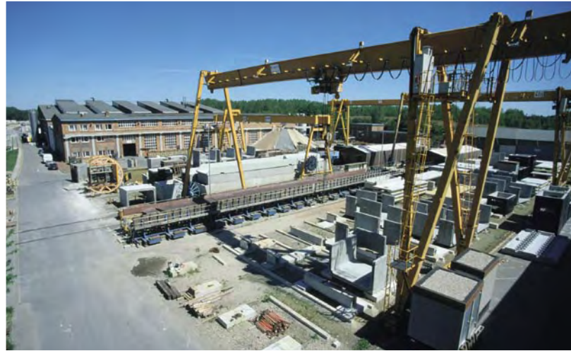
95.000 qm Betriebsfläche

Das 1997 in Brandenburg gegründete Unternehmen B+F Beton- und Fertigteilgesellschaft mbH Lauchhammer (BFL) gehört zum Unternehmensverband der Spezialtechnik Dresden GmbH, welche in einem weltweit agierenden Verbund von Marktführern der Hochtechnologie-Branche tätig ist.