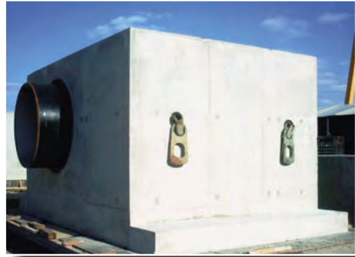
Entlüftungsschacht für Rohrleitung DN 1600

Seit vielen Jahren hat sich BFL als idealer Partner für Kommunen, Landschaftsverbände, Versorgungsunternehmen und Kunden der Großindustrie etabliert. Know-how, Fertigungsmöglichkeiten und exakt zugeschnittene Bedarfslösungen sind Voraussetzung dazu.