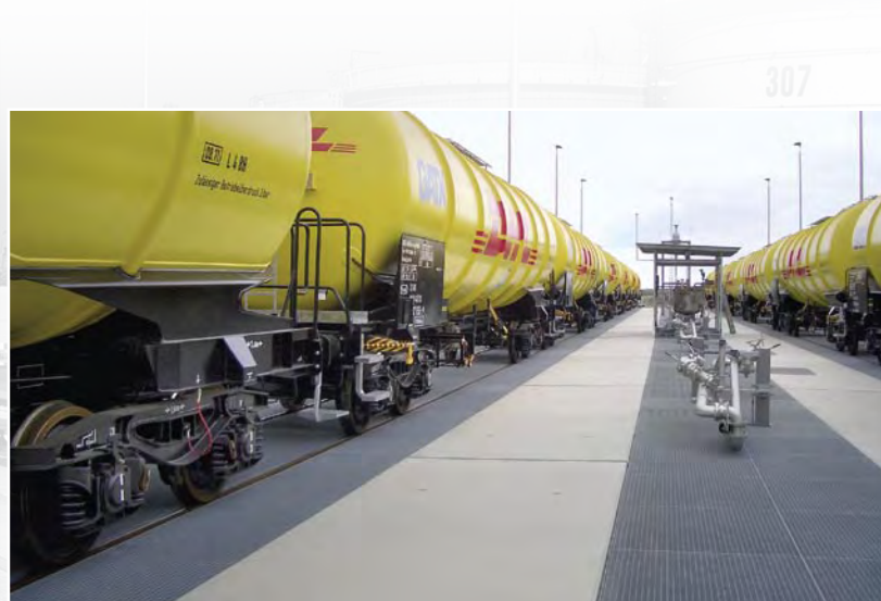
Verladeanlage für Schienenfahrzeuge