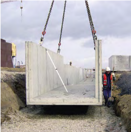
Medienkanal nach WHG