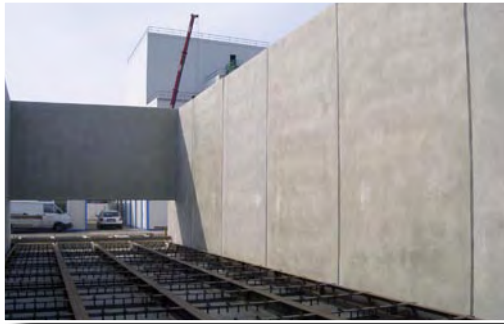
Brecheranlage für Holzkraftwerk