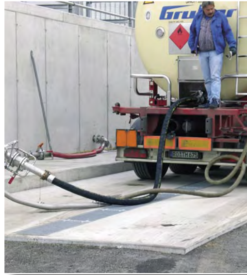
Umschlaganlage für Straßenfahrzeuge

Hohe Sachkompetenz, jahrelange Erfahrung und hoher Qualitätsanspruch, kombiniert mit Zulassungen des DIBt Berlin, unterstreichen diese hohe Zielsetzung.