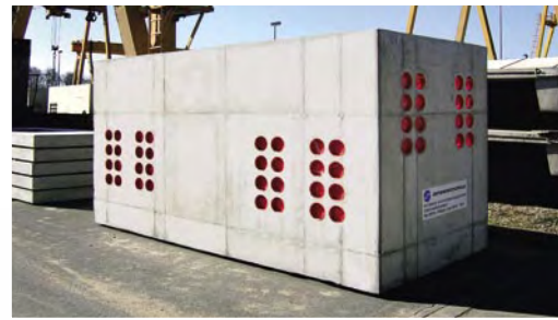
Kabelschacht mit Rohrmuffen