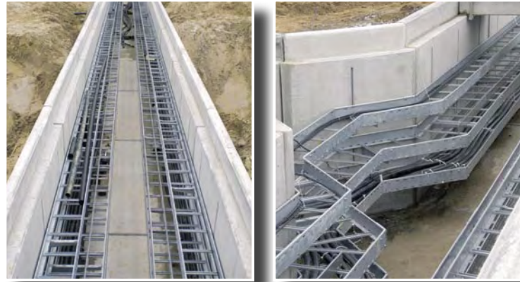
Medienkanäle mit Kabelpritschen

Hierfür finden sich in der umfassenden Produktpalette sämtliche für den Bau von erdgebundenen Leitungstrassen benötigten Artikel.